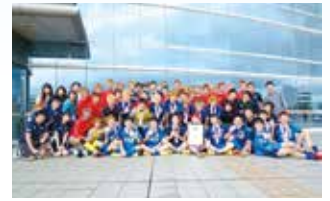
全日本大学フットサル大会で優勝した学友会フットサル部